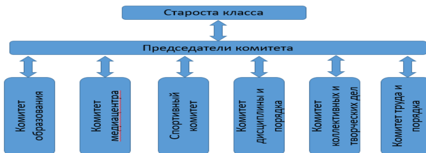
СХЕМА взаимодействия членов Совета класса

• через деятельность выборных органов самоуправления, отвечающих за различные направления работы класса (комитет образования, комитет медицентра, спортивный комитет, комитет коллективных и творческих дел, комитет дисциплины и порядка, комитет труда и порядка).